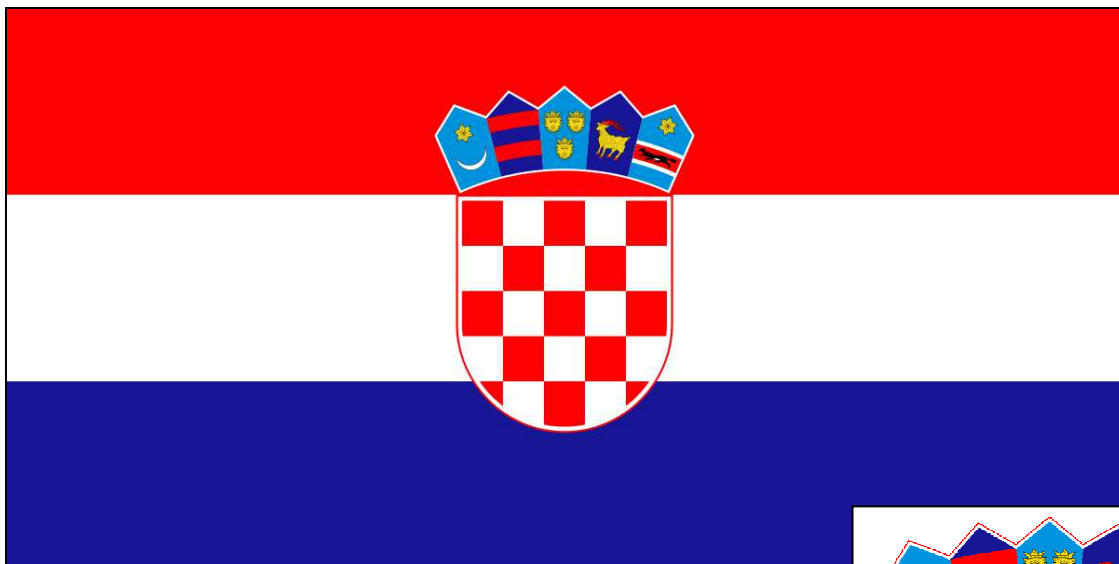
Drapeau de la Croatie tel qu'il existe depuis le 21/12/1990

Pour marquer la différence entre la Croatie de 1991 et l'État indépendant de Croatie, satellite de l'Allemagne nazie, et la république socialiste yougoslave, le blasonnement est aujourd'hui surmonté d'une couronne, composée de cinq écus qui correspondent aux principales régions historiques de la Croatie :